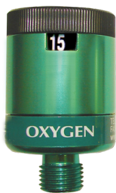
Flujómetros tipo dial para oxígeno