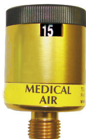
Flujómetros tipo dial para aire medicinal