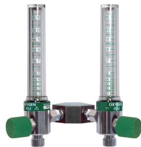
Flujómetros con montaje doble o bloque en Y