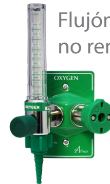
Flujómetro no removible