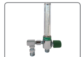
Toma de potencia