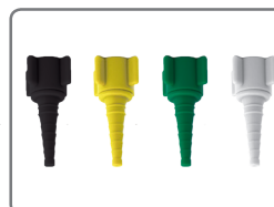
Conexiones giratorias/ tipo árbol de Navidad