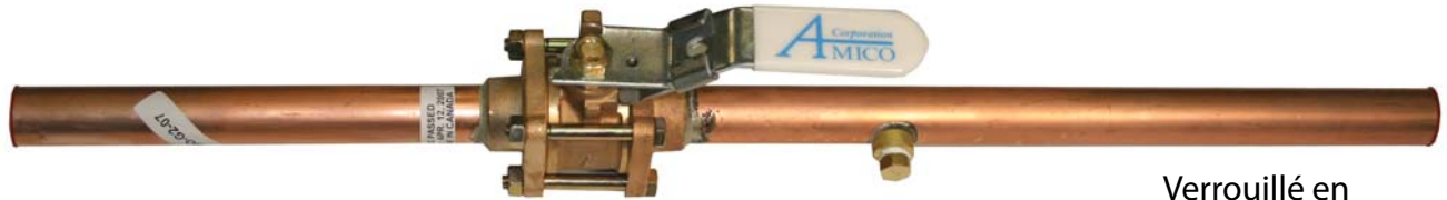
Verrouillé en position ouverte (Le cadenas n'est pas montré)